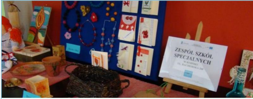
Fot. Patrycja Wróblewska

26 maja 2010, autor: Patrycja Wróblewska