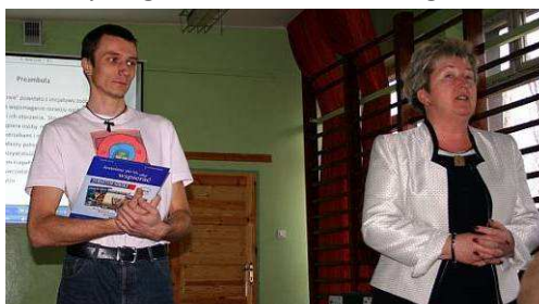
Spotkanie założycielskie

Podczas spotkania założycielskiego (04.2008) został uchwalony statut, wybrano władze Stowarzyszenia (34 członków założycieli). Nastąpiła sądowa rejestracja Stowarzyszenia (wpis do Krajowego Rejestru Sądowego), podpisano umowę użyczenia lokalu z dyrekcją SOS-W w Rybniku, nadano Stowarzyszeniu numer REGON oraz NIP, otwarto konto bankowe. Podczas Nadzwyczajnego Walnego Zebrania Członków Stowarzyszenia (10.2008) został uchwalony Regulamin Obrad Walnego Zebrania Członków Stowarzyszenia, Regulamin Działania Zarządu Stowarzyszenia, Regulamin Działania Komisji Rewizyjnej Stowarzyszenia. Przyjęto także plan pracy