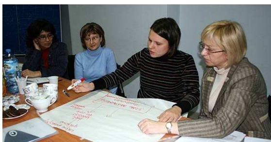
Szkolenie „Tworzenie projektów”

Bieżące informacje o szkoleniach dla członków Stowarzyszenia znajdują Państwo na tablicy informacyjnej w szkole (korytarz