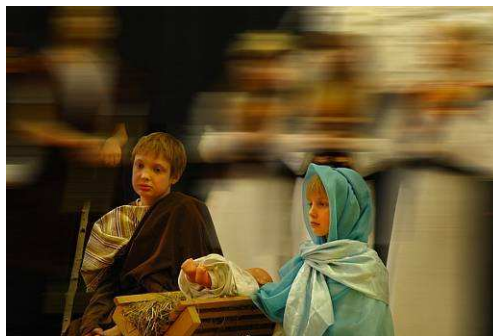
Narodziło się Dzieciątko...

Przyznano również nagrody w kategoriach: najlepszy aktor i aktorka, najlepszy wokalista i wokalistka, a także nagrody grupowe i indywidualne, m.in.: dla opiekunów grupy z Ośrodka Matka Boża Różańcowa w