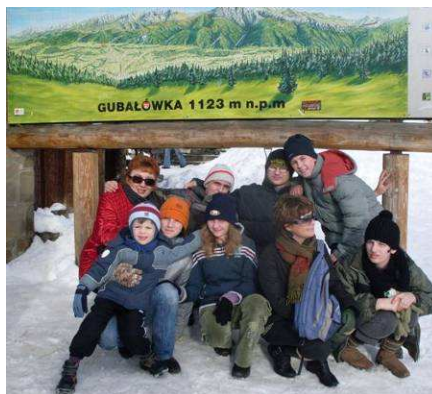
Pod Gubałówką

górkę zjeżdżać na sankach. Następnego dnia pojechaliśmy na Gubałówkę i jechaliśmy kolejką szynową. Gdy kolejka się zatrzymała wyszliśmy z kolejki i szliśmy na spacer. Po spacerze poszliśmy do karczmy. W karczmie w Zakopanem zamówiliśmy czekoladę na gorąco, później poszliśmy do kolejki linowej a w kolejce linowej rozmawialiśmy o samochodach i o Harnasiu. Tego samego dnia wieczorem był kulig i smażenie kiełbasek. W piątek byliśmy po śniadaniu na spacerze, a potem poszliśmy na basen termalny z panią Kasią. Wieczorem oglądaliśmy film „Piotruś i Wilk”. Chciałbym jeszcze pojechać w to miejsce za rok.