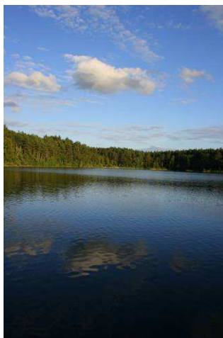
Jeziro Zakrzewie nad którym leży Ośrodek „Stawiska”

Dzięki porozumieniu z Gdańską Fundacją Dobroczynności, dzieci wyjadą na turnus rehabilitacyjny na okres 14 dni do Ośrodka Szkoleniowo-Wypoczynkowego „Stawiska” w Stawiskach (gmina Stary Bukowiec). Został podpisany list intencyjny, ustalono warunki odpłatności za pobyt dzieci oraz zakres działań rehabilitacyjnych. Koszty pobytu dzieci na turnusie pokryte mogą być z dofinansowania PFRON oraz wpłat własnych rodziców. Kierownikiem wyjazdu będzie Krzysztof Chełstowski. W trakcie turnusu dzieci objęte będą codziennymi zajęciami z dogoterapii, rehabilitacji ruchowej, zajęciami z pedagogiki zabawy. Pod okiem doświadczonej kadry będą miały dostęp do kąpieliska oraz sprzętu wodnego (rowerki wodne, kajaki). W trakcie wyjazdu zorganizowane zostaną wycieczki do Gdyni oraz rejs statkiem. Będą również inne atrakcje: bal przebierańców, podchody, ogniska, zawody sportowe, dyskoteki itp. Zainteresowanych bazą lokalową ośrodka do którego wyjadą dzieci zapraszamy na stronę: